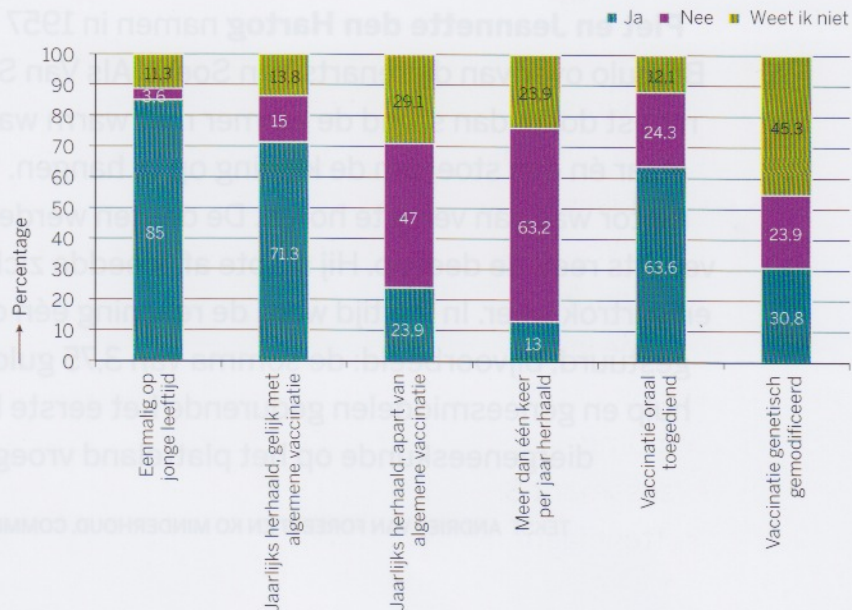
Figuur 2. Bereidheid tot vaccinatie per scenario, weergegeven in percentages.